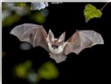
Het was de vleermuis.