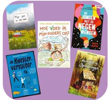
Boeken van groep 7 & 8

Elke groep heeft boeken gekregen, die met het thema te maken hebben. Tijdens de Kinderboekenweek moet er vooral veel aandacht zijn voor lezen, dus wanneer er een boek is uitgelezen, mogen de kinderen een boekrug inkleuren. Zo wordt er een lange rij van boekruggen gemaakt in de gang en kunnen we zien hoeveel er gelezen is.